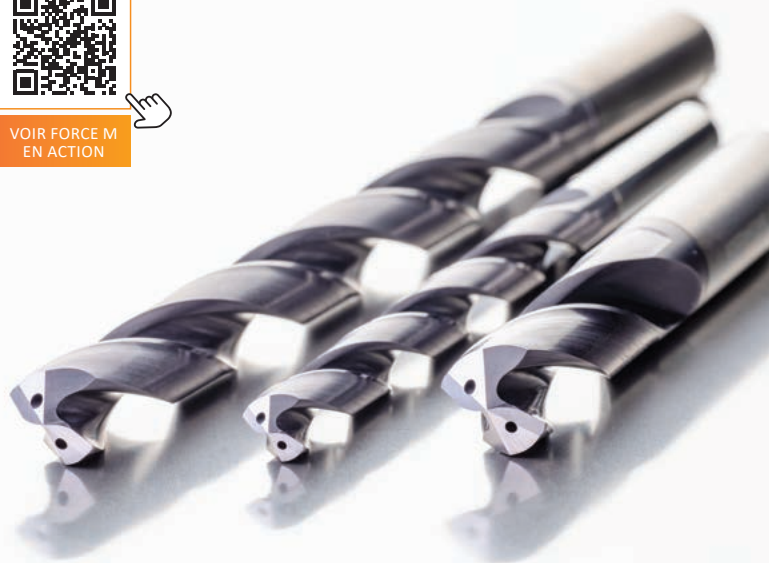
Forets de production de grandes séries pour l'acier inoxydable