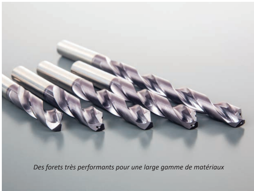
Des forets très performants pour une large gamme de matériaux