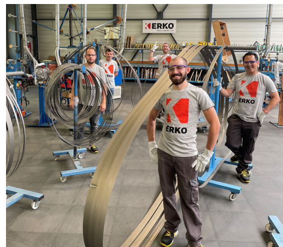
Notre équipe de soudage de Grenoble !

Au choix : WILLIAM LAWSON'S 70cl (1) Code 3410162 RICARD 70cl (1) Code 3410161 GET 27 70cl (1) Code 3410446 JACK DANIEL'S 70cl (1) Code 3410461